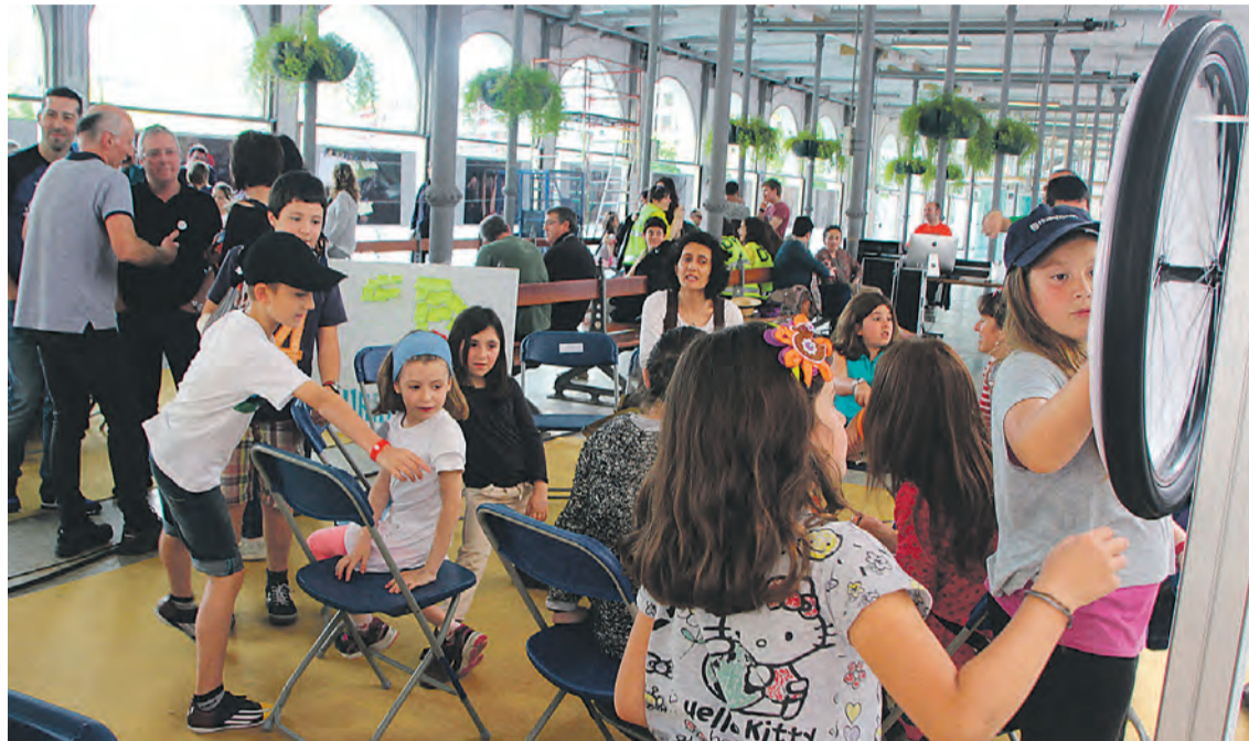
Haurren Kontseiluan beren ikuskera eta iritziak plazaratzen dituzte 8 eta 12 urte bitarteko gaztetxoek. ATARIA

Eta, bide horretan, gizarteak errealitate hori «naturaltasunez» ikusten du: «Haurrak izaki txiki eta ahul moduan ikusten ditugu helduok sarri, etorkizuneko proiektu moduan. Ez dugu ikusten, ordea, haurrak jabetu egiten direla, eta gutxietsita sentitzen direla».